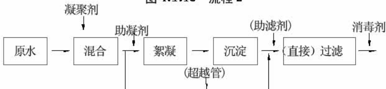
图 4.1.1c 流程 3

注:①当原水浊度小于 50 度,水厂规模较小时,可不设絮凝、沉淀池,采用微絮凝过滤。